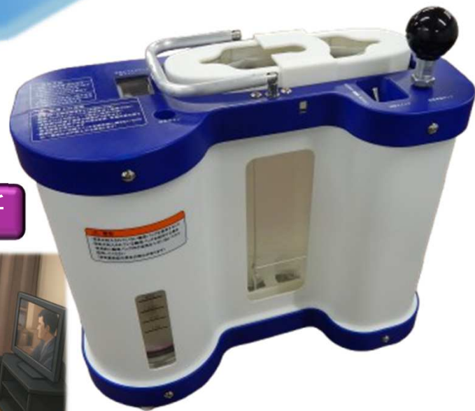
ツルサース 点滴静注 500mL 用ポンプ

東京都 Tokyo Trial Purchase Products トライアル 発注認定商品